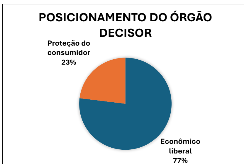
Gráfico 1 – Fonte: Elaboração própria, 2025. Conferir anexo único.

Seguindo a aplicação do método, questiona-se: “De que maneira as mulheres foram preteridas?”, ao que se pode concluir que a livre iniciativa foi colocada em patamar prioritário em relação à dignidade da pessoa humana, especificamente no âmbito da proteção à consumidora mulher, diante de situações que envolvam a intervenção do Estado na economia, como é possível verificar no gráfico abaixo: